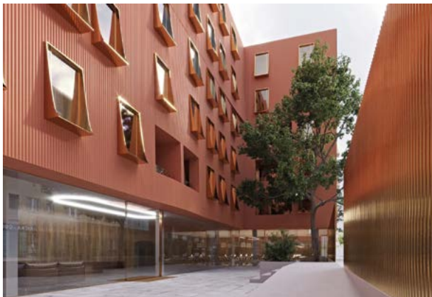
vizualizace: U Milosrdných

Mezi aktuálně prodávané projekty se řadí Jinonický dvůr v Praze (dokončeno), Nová Valcha v Plzni (dokončeno 6 etap z 11) či rezidence Nové Boroviny v Kladně (dokončena 1. etapa).