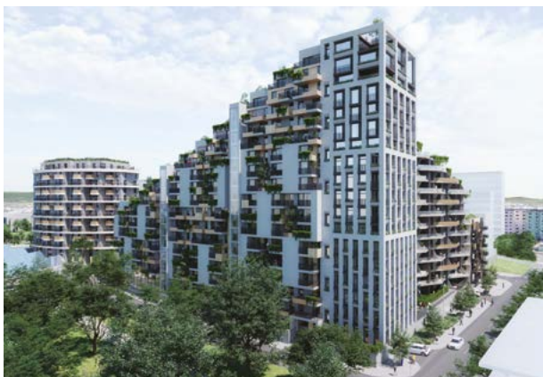
vizualizace: Západní Brána

V realizaci je projekt U Milosrdných na Praze 1 (kolaudace podzim 2024). Další z pražských projektů bytových domů jsou v přípravě: K Závěrci , Bytový dům Grébovka či Kačerov .