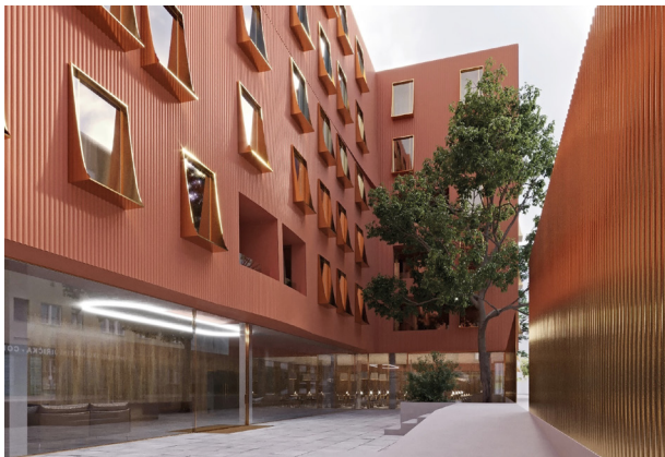
vizualizace: U Milosrdných

Mezi aktuálně prodávané projekty se řadí Jinonický dvůr v Praze (dokončeno), Nová Valcha v Plzni (dokončeno 6 etap z 11) či rezidence Nové Boroviny v Kladně (dokončena 1. etapa).